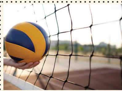
TINKLINIS & KREPŠINIS