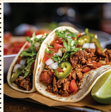
TAKO gamybos pamokos