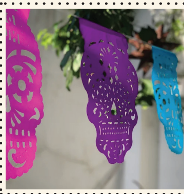
PAPÉL PICADO (popierinės dekoracijos)