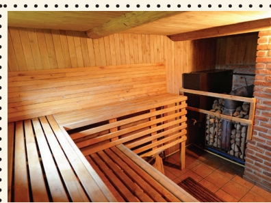
PIRTIS & KUBILAS