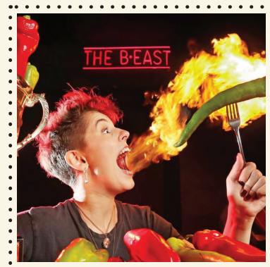
CHILI PEPPERS aštrumo iššūkis