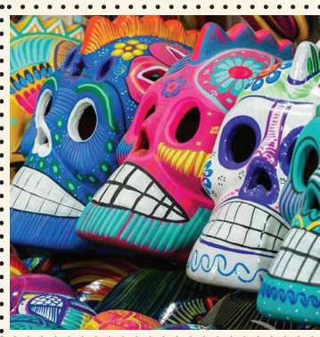
DÍA DE LOS MUERTOS kaukių kūrimas