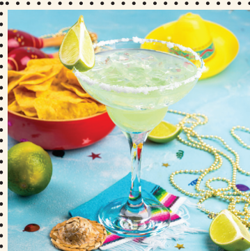
MARGARITA & TEKILA GAMYBA IR IŠŠŪKIS